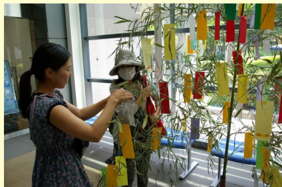
短冊に願いを込めて