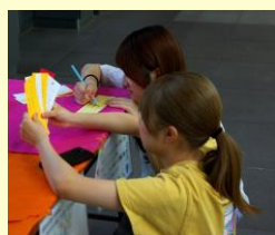
4 4 3 枚の短冊に色々な願いが込められていました。