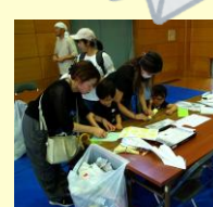
ぶんぶんゴマ作り